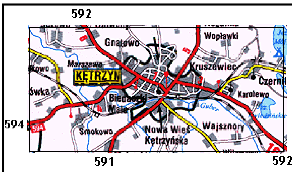
Oznaczenie dróg wojewódzkich przechodzących przez Miasto Kętrzyn

Mając na uwadze generalnie zły stan dróg, winny być podjęte przez rząd rozwiązania systemowe co do administrowania drogami i ich finansowania.